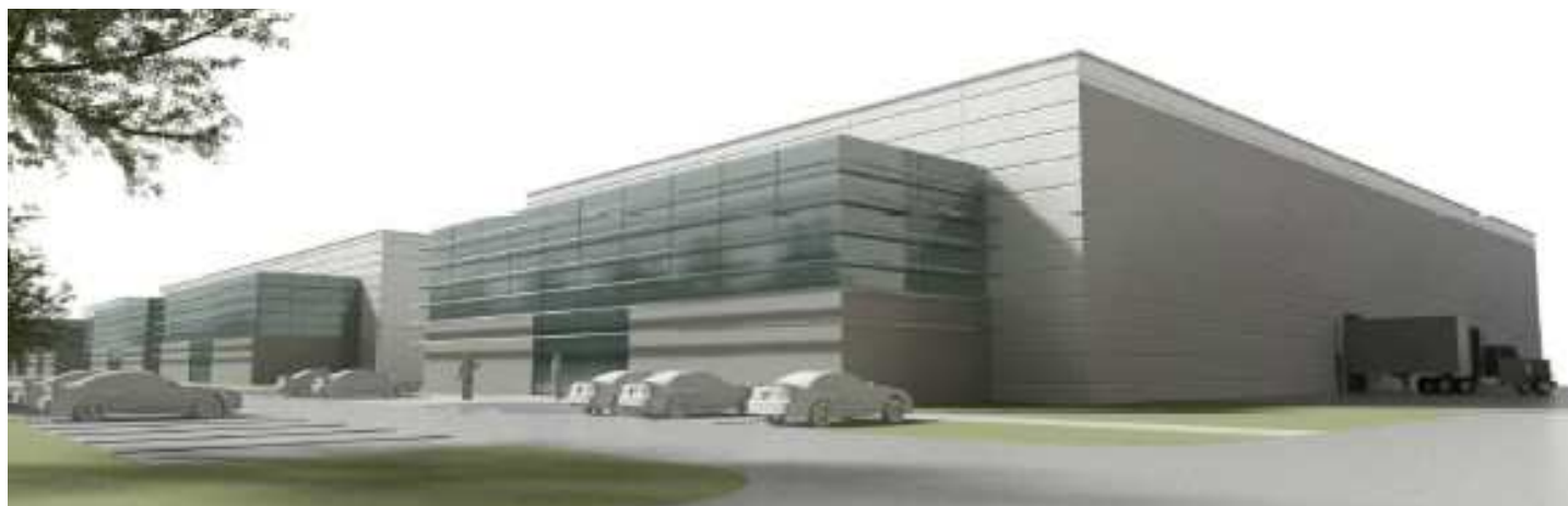
Wizualizacja kompleksu obiektów przy ul. Nad Drwiną

W celu uzyskania szczegółowych informacji prosimy o kontakt: