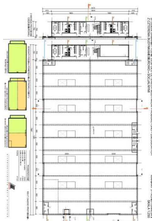
Plan jednego z czterech obiektów

Budynki przylegające do hal produkcyjno-usługowych Dwukondygnacyjne - na parterze powierzchnie socjalne, na piętrze biura Powierzchnia biura - ok. 130 m 2 w każdym budynku Powierzchnia zaplecza socjalnego - ok. 200 m 2 w każdym budynku Możliwość rozbudowy (3 kondygnacja)