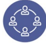
Inwestycje społeczne i umiejętności