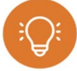
Badania, innowacje i cyfryzacja