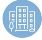
Małe i średnie przedsiębiorstwa