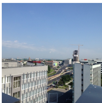
Widok budynku przy ul. Kordylewskiego 11 (od strony al. Powstania Warszawskiego i ul. Kordylewskiego) oraz aktualny sposób zagospodarowania oferowanej powierzchni (dach)