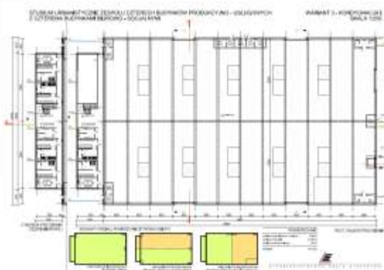
Plan jednego z czterech obiektów