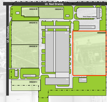
Obszar inwestycji na terenie MARR Business Park